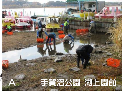
A 手賀沼公園 湖上園前

※昨年の活動の様子 (写真 A) 外来水生植物駆除 (写真 B) 外来水生植物駆除と 生き物救出作戦